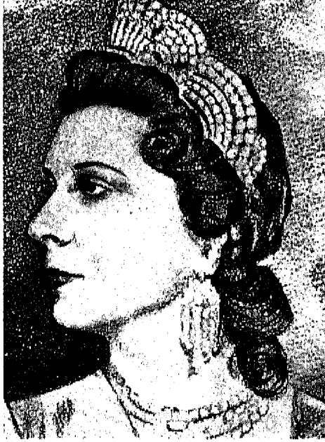
لوحة نادرة للملكة نازلى وهى بالتاج الملكى